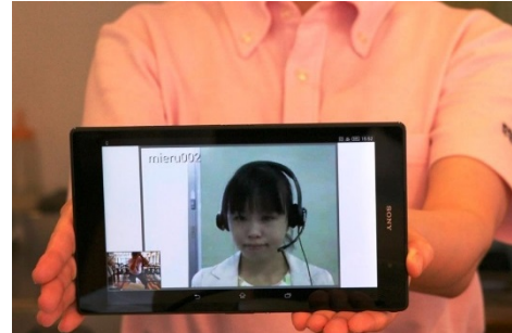
「みえる通訳」を利用してお客様対応

食文化を含めた東北の文化をよりよくご理解頂き、さらに東北各地の名産品のショッピングを楽しんで頂けるよう三者間の映像通訳サービスを選びました。