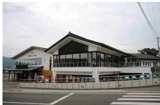
平泉レストハウス様全景